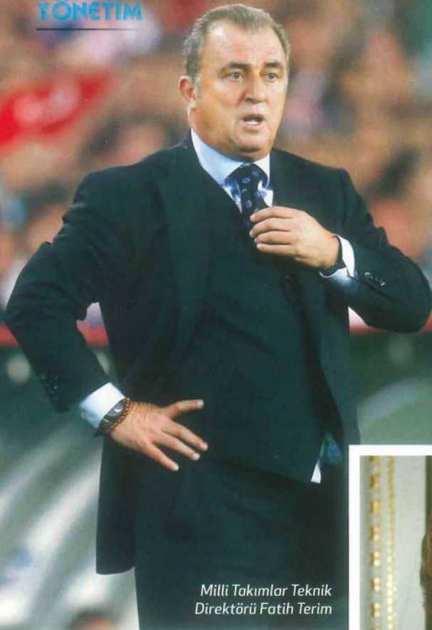
Milli Takımlar Teknik Direktörü Fatih Terim

Alfa patronun özelliklerine ve modasının geçip geçmediği konusunda süren tartışmaya geçmeden önce bir örnek daha verelim. Oscar Ödülleri'nde büyük başarı kazanan Whiplash filmi de çok başarılı ama öğrencilerine "diktatörce" davranan bir müzik öğretmenin öyküsünü anlatıyordu. Yerli yabancı tüm kaynakların ve bu haberi hazırlarken görüşüne başvurduğum yönetim danışmanları ve akademisyenlerin ortak kanısı, alfa patronları parlatan niteliklerinin aynı zamanda onları birlikte çalışılması zor insanlar haline getirdiği yönünde. Alfa patronların iyi yö-