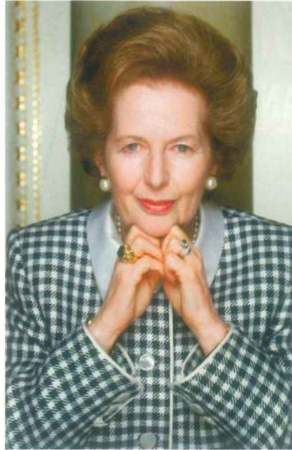
Alfalar, iş dünyasından olmak zorunda değil. Thatcher, hem kadın hem siyaset arenasının nam salmış alfalarından.

neticiler olduğuna kuşku yok. Doğal bir karizmaları olduğuna da.