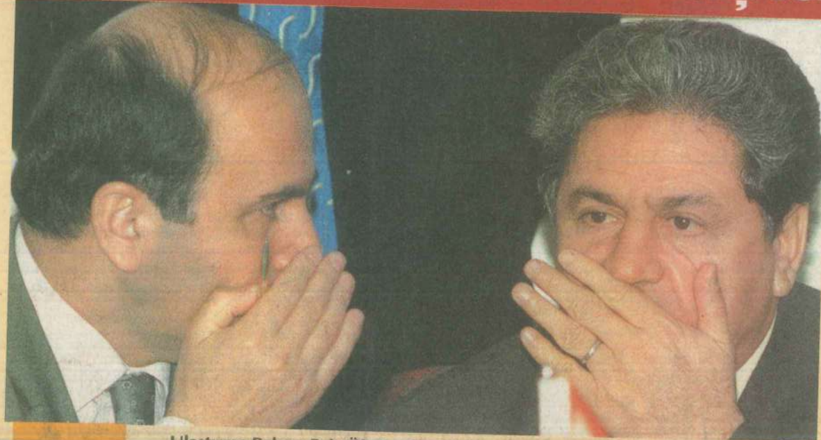
Ulaştırma Bakanı Enis Öksüz dün Telekom'la ilgili açıklamalarda bulundu.